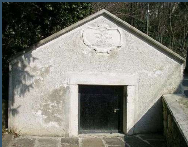
Il Capofonte Teresiano