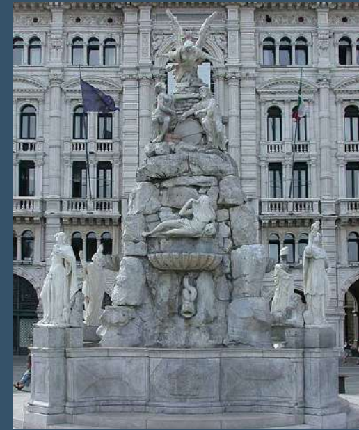
La fontana dei Continenti in piazza Unità