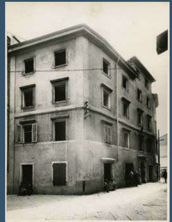
Casa Bonomo in via del Pozzo Bianco (demolita nel 1937)