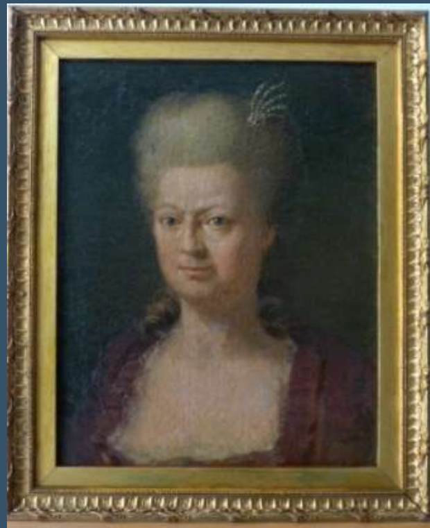
Pittore austriaco del XVIII sec.

olio su tela Versailles, Palace de Versailles