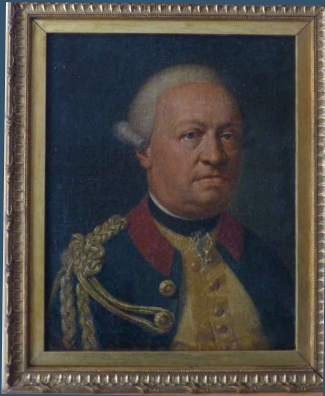
Pittore austriaco del XVIII sec.