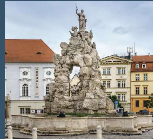
La fontana del Parnaso nella piazza del Mercato di Brno