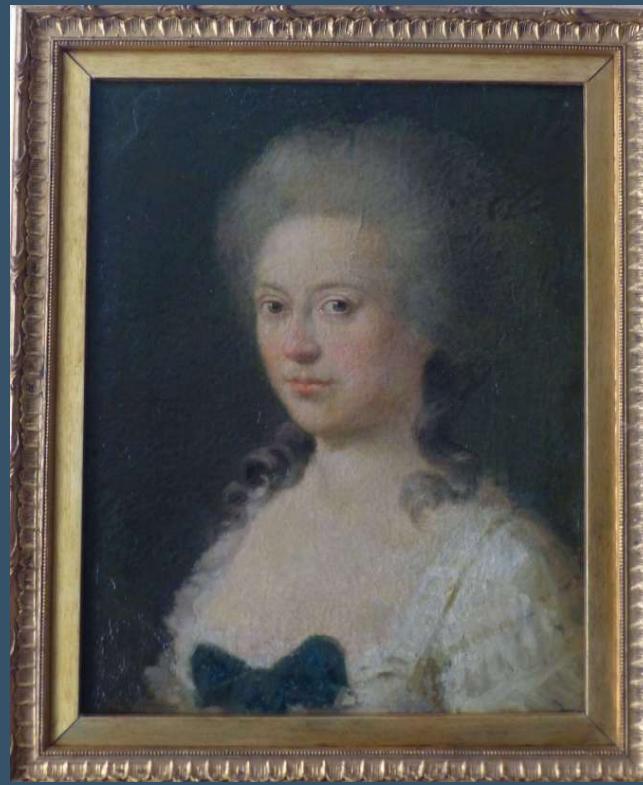
Pittore austriaco del XVIII sec.