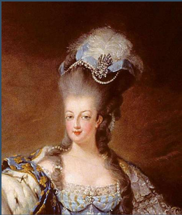
Jean-Baptiste André Gautier-Dagoty

Maria Antonietta d'Asburgo Lorena, regina di Francia (1755-1793), 1775