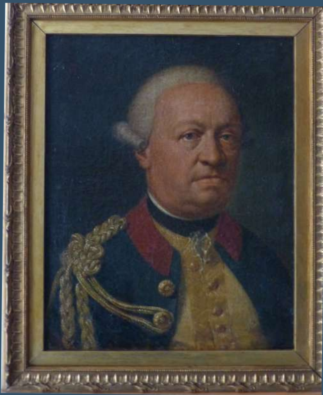
Pittore austriaco del XVIII sec.