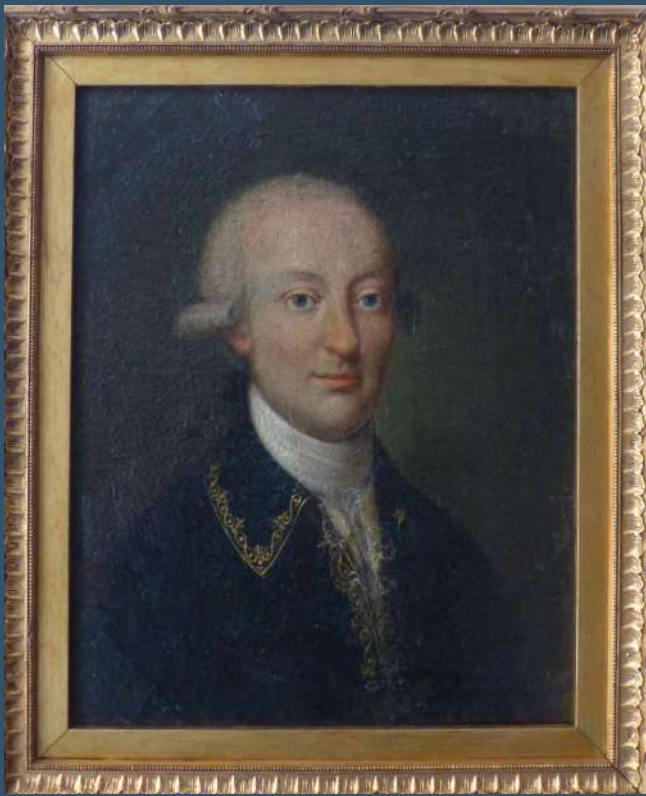
Pittore austriaco del XVIII sec.