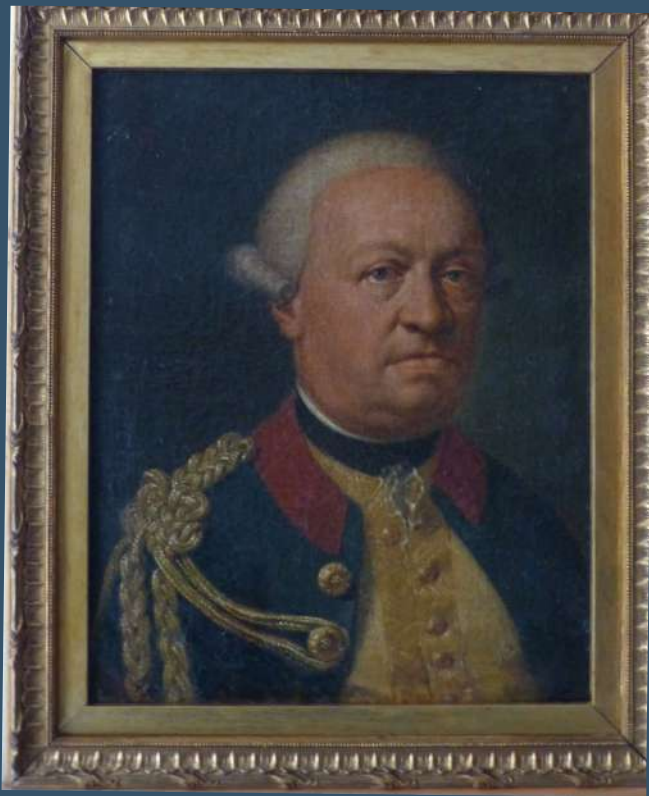
Pittore austriaco del XVIII sec.