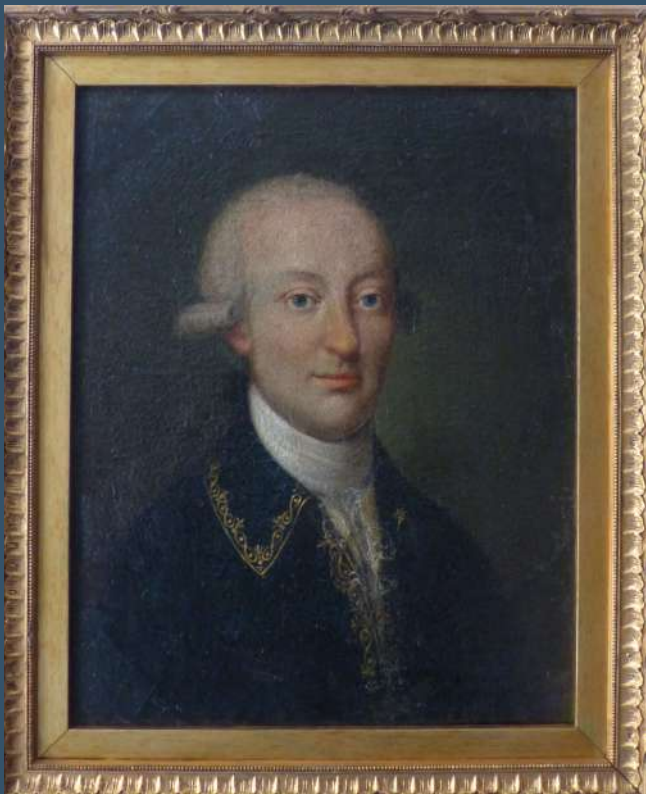
Pittore austriaco del XVIII sec.